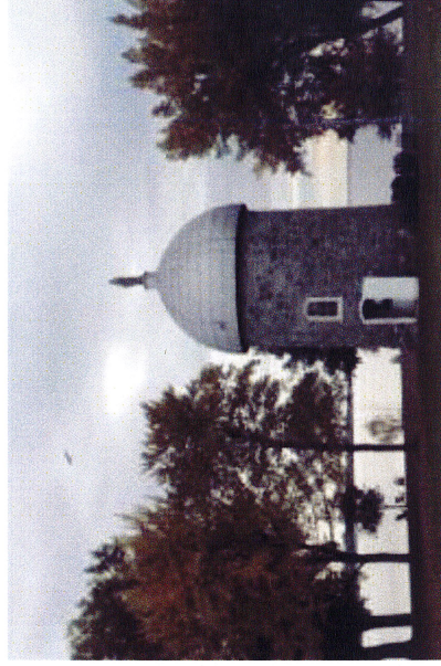
Manoir d'Youville, ancien moulin, Châteauguay

La Fondation Compagnon nous reçoit avec générosité dans cette hôtellerie réputée aux confins de la rivière Châteauguay et du lac St-Louis. (ancienne propriété patrimoniale transformée des Sœurs de la Charité)